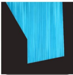
〈Beyond the Visible〉

〈Who Likes Obang Color?〉(2021) 연작은 예로부터 동양문화권의 핵심 사상이었던 음양오행을 상징하는 다섯 가지 색을 나타낸 작품이다. 황, 청, 적, 흑, 백의 색이 지닌 오묘함을 통해 동양의 미(美)를 작품 속에 녹여냈다. 겉으로 드러나는 빛나는 색채의 이면에는 무수한 수직선들이 보인다. 이 선들은 무한 속으로 한없이 침잠하는 동시에 앞으로 질주하듯 다가오며 공간을 형성한다.