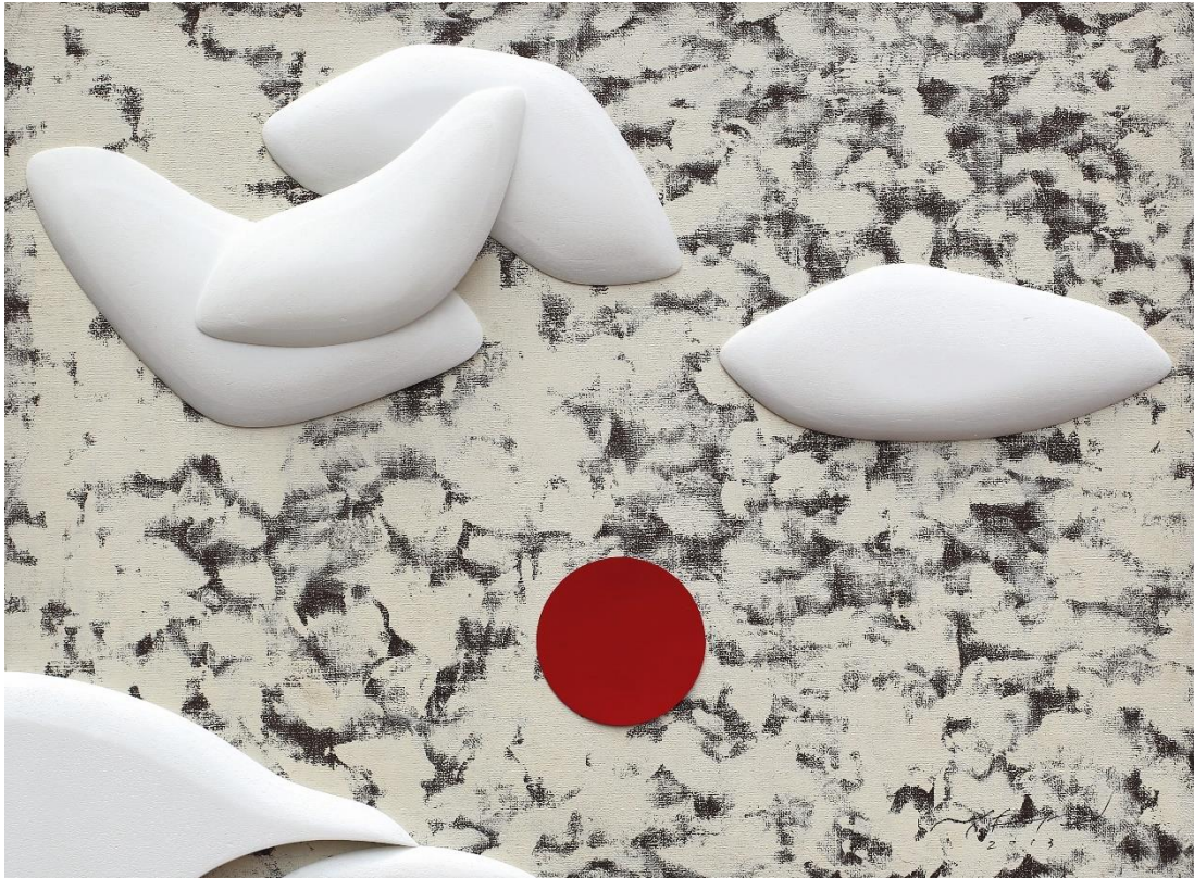
<공존-꿈>, 2012, 캔버스에 혼합재료, 54x40x10cm