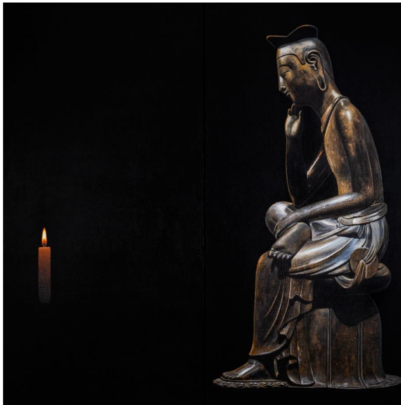
불이(不二)_무무명, 2025, 캔버스에 아크릴릭, 130x130cm